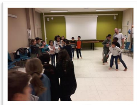
Rots en Water

Elke zorgvraag wordt besproken tijdens het zorgoverleg en daar omgezet in zorgacties.